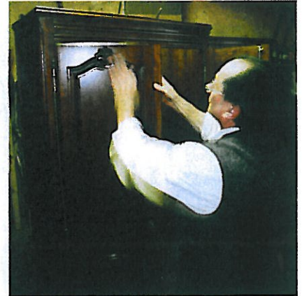
La Lorraine s'affiche en tête de peloton dans le domaine de la filière de l'ameublement notamment grâce à la démarche de certification PEFC mise en œuvre par le Plab.