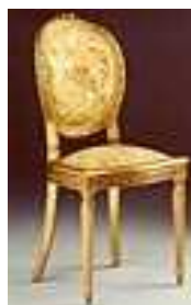
Chaise Louis XVI