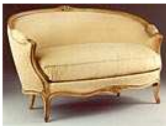
Canapé Louis XV