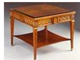
Petit meuble Empire - Directoire