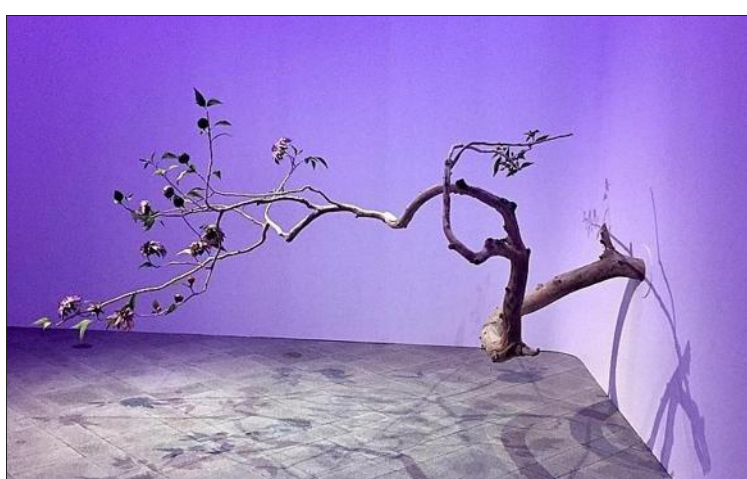
L'artiste plumassière Nelly Saunier a fait appel à Hervé Mayon afin de créer cette branche japonisante pour le National museum de Tokyo. Il a écorcé une branche de pommier, insérée des rameaux qu's'affinent à l'extrémité jusqu'à 5 mm. Nelly Saunier a composé les fleurs de dahia en plumes. Photo Nelly SAUNIER