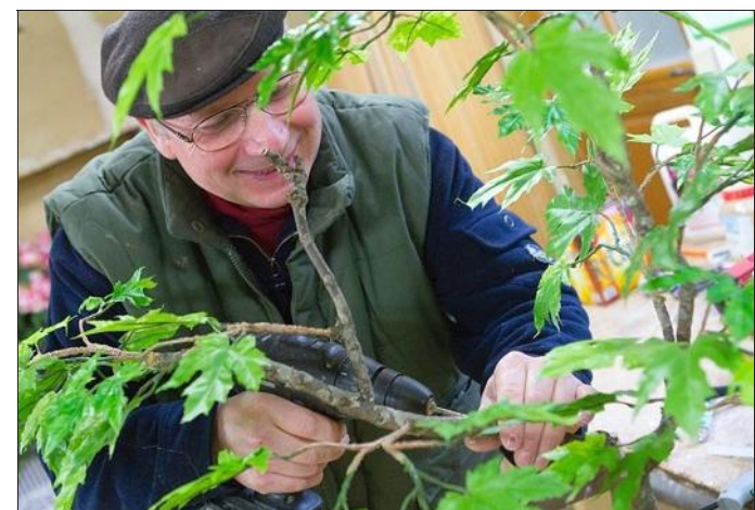
Feuilles, fleurs ou fruits sont collés un à un à la main ; éléments artificiels ou feuillage naturel stabilisés. Il façonne également ses propres pièces, comme les cabosses pour le Salon du chocolat à Paris.